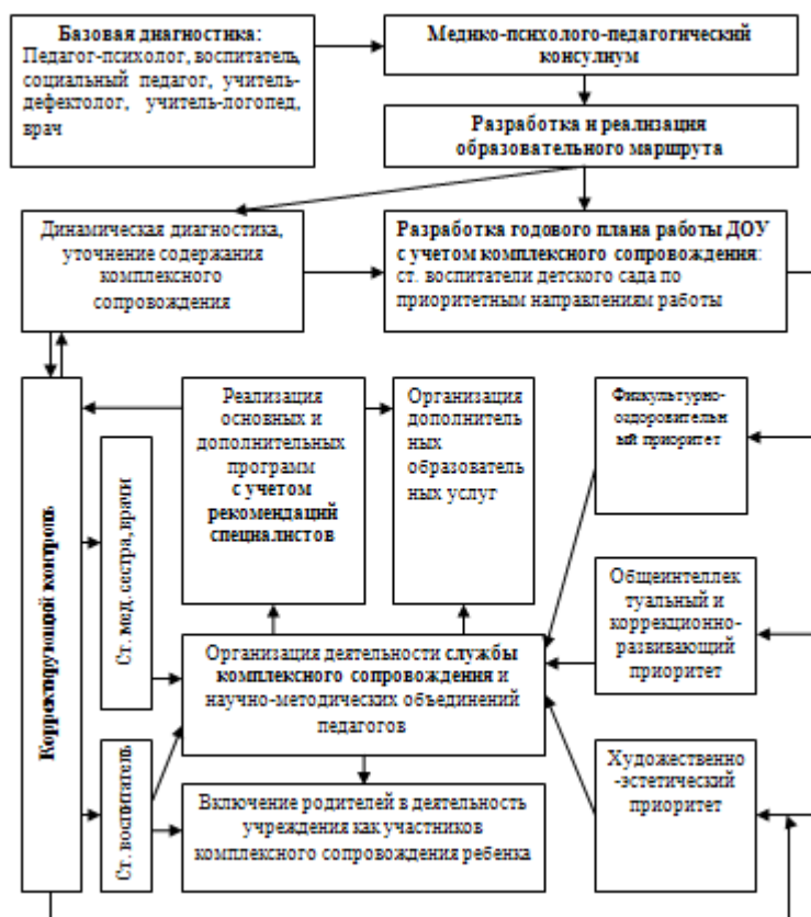
Схема взаимодействия специалистов

Работой по образовательной области «Речевое развитие» руководит учитель-логопед, а другие специалисты подключаются к работе и планируют образовательную деятельность в соответствии с рекомендациями учителя-логопеда.