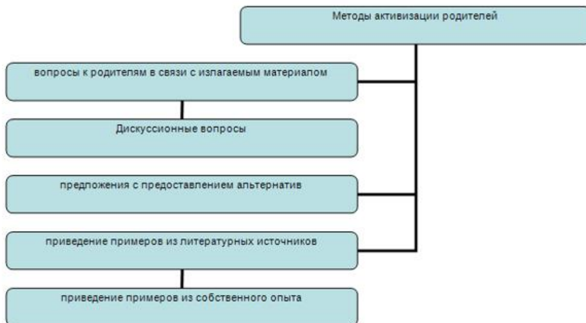
Схема. Методы активизации родителей

3 этап - формирование у родителей более полного образа ребенка и правильного его восприятия, включение родителей в образовательное пространство.