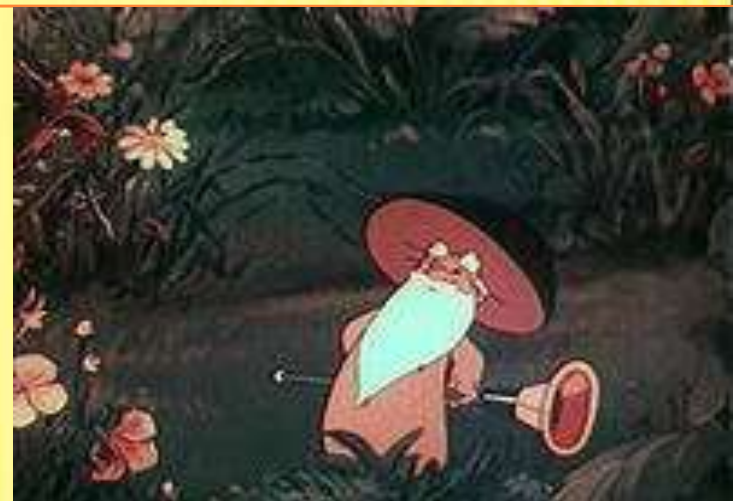
«Дудочка и кувшинчик»