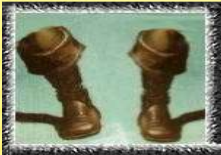
«Кот в сапогах»